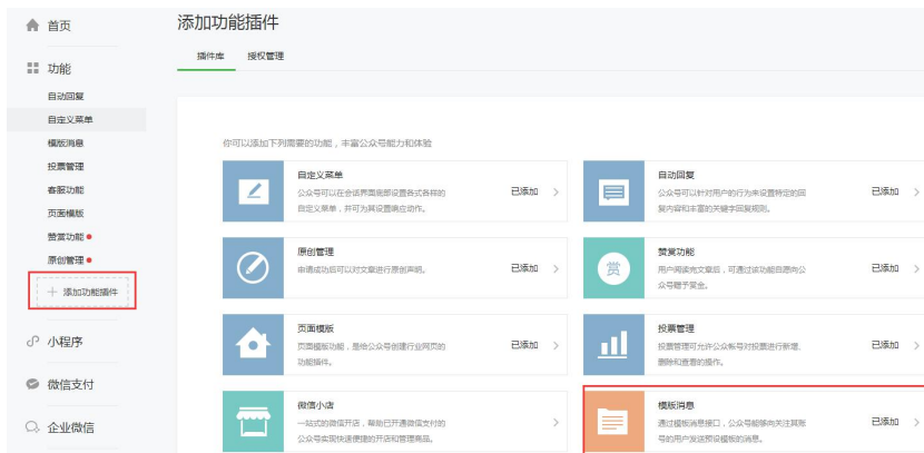
图 d 添加模板消息插件